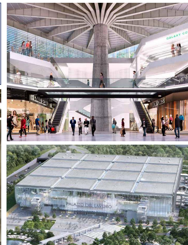
RENDER DI PROGETTO